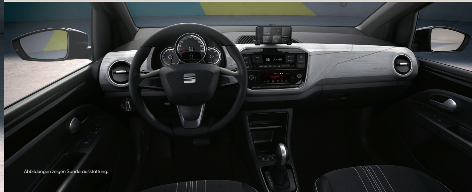
Abbildungen zeigen Sonderausstattung.