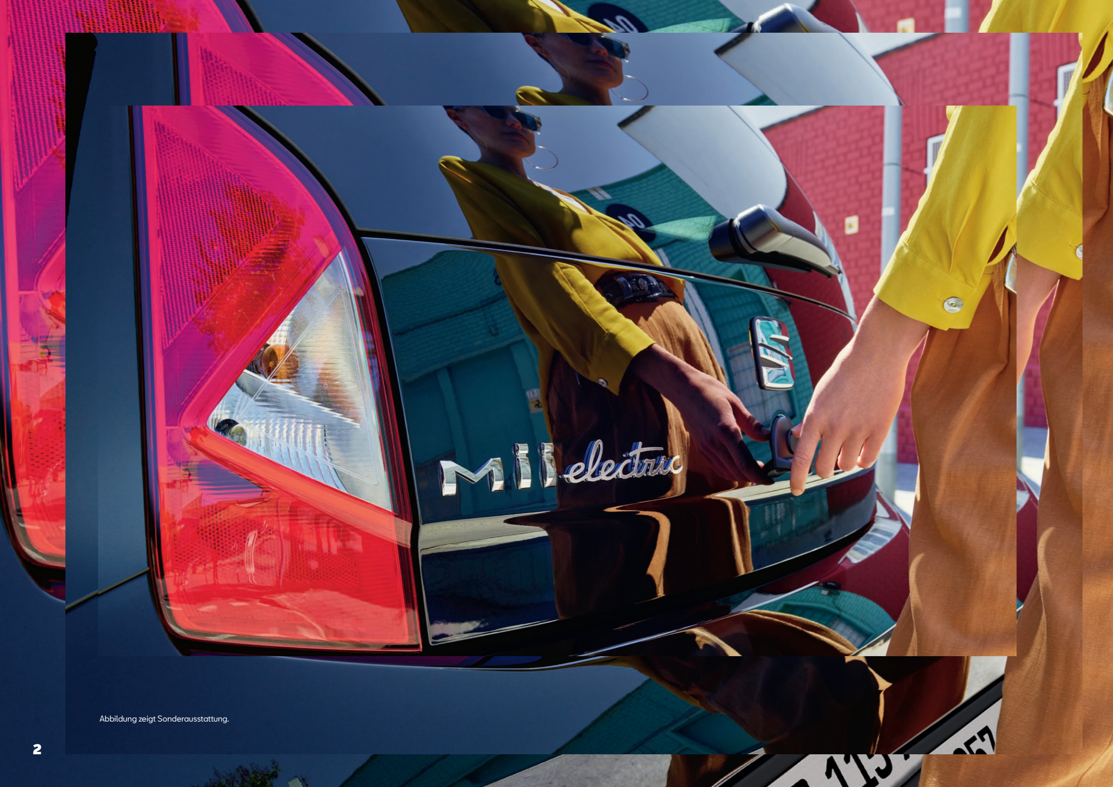
Abbildung zeigt Sonderausstattung.