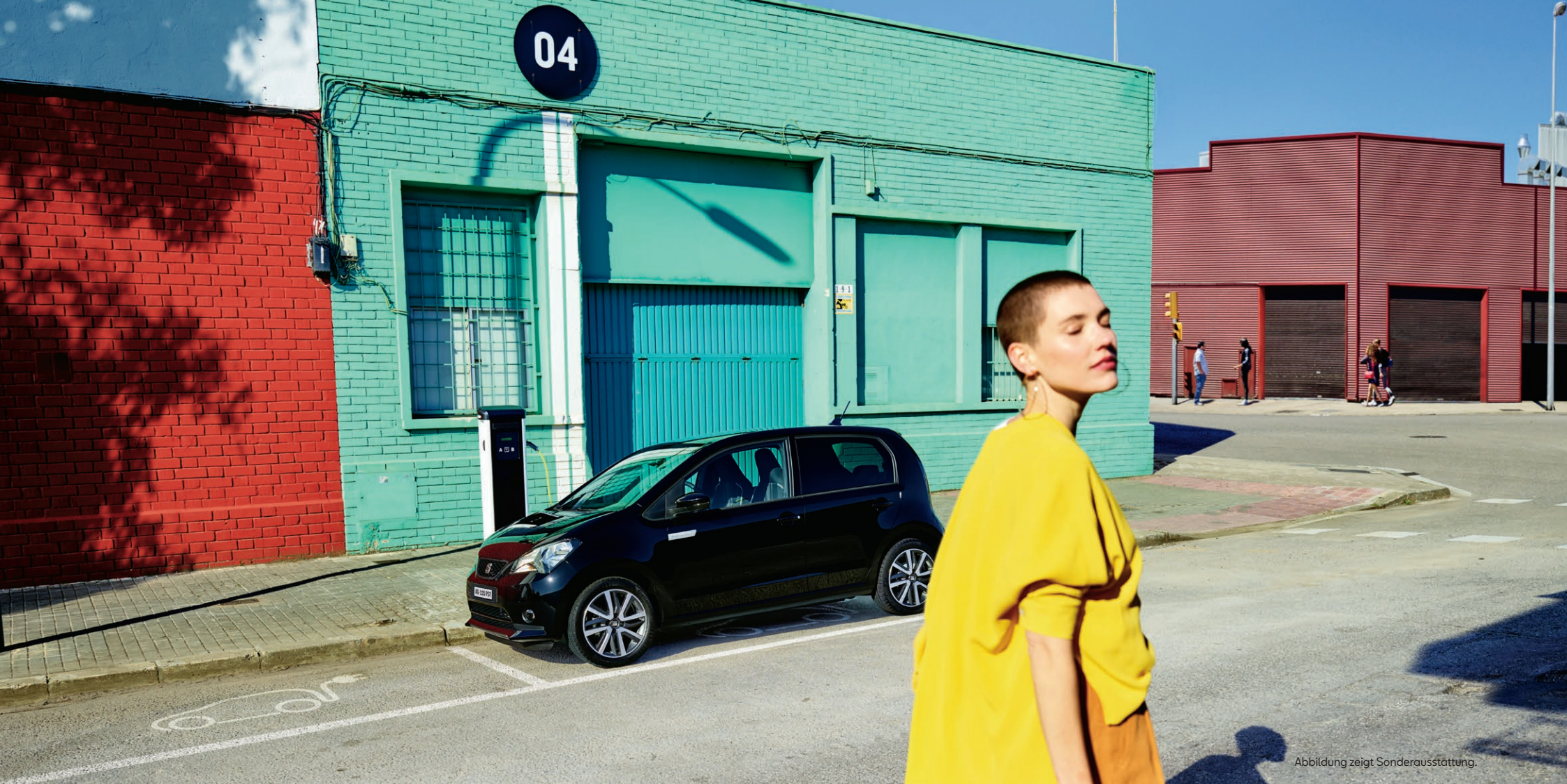
Abbildung zeigt Sonderausstattung.